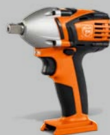
Akumulátorový přiklepový šroubovák ASCD 18 W2

Zaplatíte jen za to, co skutečně potřebujete – ani víc ani méně.