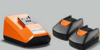
Startovací sada akumulátorových baterií 18V/2Ah