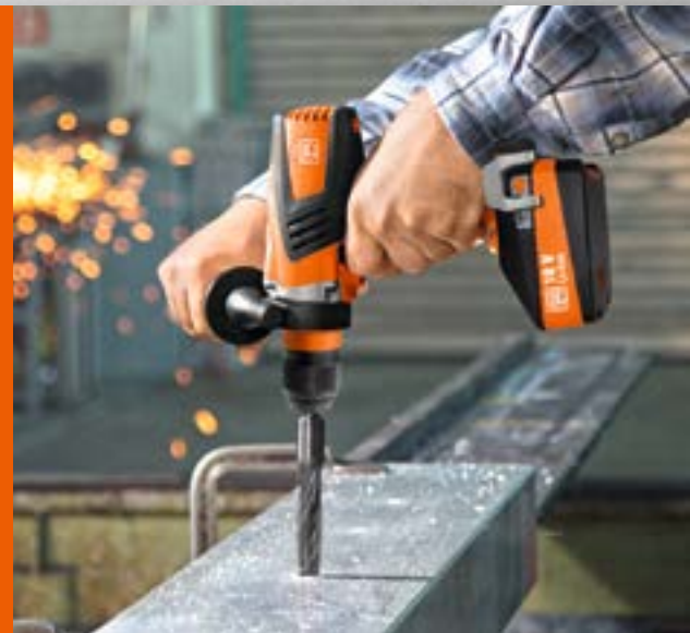
Taladro atornillador de 4 velocidades

Solo tiene que registrarse el producto en un plazo de 6 semanas tras la compra en www.fein.com/warranty .