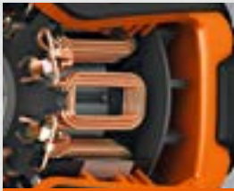
Motores PowerDrive FEIN sin escobillas

Los atornilladores de impacto a batería FEIN resultan muy adecuados para apretar y aflojar tornillos métricos. El elevado rendimiento de los motores PowerDrive FEIN sin escobillas ofrece un par de hasta 290 Nm. Con el ajuste del par electrónico puede adaptarse el par en 6 niveles al par de apriete deseado según el tamaño del tornillo. Asimismo, los tornillos apretados pueden soltarse con mayor facilidad en caso de bloqueos por carga o corrosión gracias al par un 10 % superior. en giro a izquierda