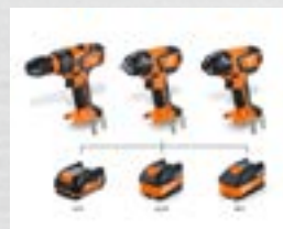
MultiVolt: funciona con todas las baterías de iones de litio FEIN