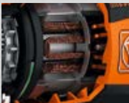
Motores PowerDrive FEIN sin escobillas

La perfecta interacción entre la batería, el sistema electrónico y el motor hacen que los taladros atornilladores a batería FEIN sean extremadamente potentes. Los motores PowerDrive FEIN sin escobillas convencen por su máxima duración. Su rendimiento un 30% superior consume menos batería y permite una duración mayor de la misma. Las elevadas velocidades de corte optimizadas permiten perforar metal con rapidez y precisión. El cambio rápido entre las distintas aplicaciones es posible con los accesorios QuickIN.