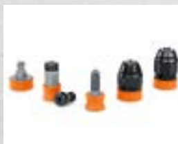
Cambio rápido entre las aplicaciones