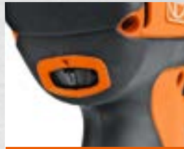
Pares ajustables según el tamaño del tornillo