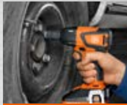
Extracción de tornillos muy apretados