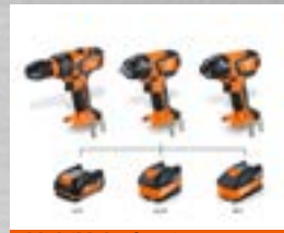
MultiVolt: funciona con todas las baterías de iones de litio FEIN