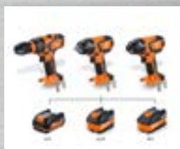
Kan köras med alla FEIN litiumjonbatterier