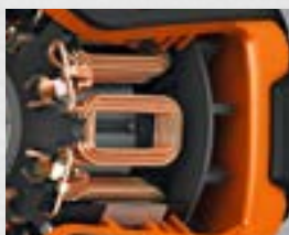
Borstlösa FEIN PowerDrivemotorer

FEIN sladdlösa mutterdragare är optimalt lämpade för att fästa och lossa metriska skruvar. Den höga verkningsgraden för de borstlösa FEIN PowerDrive-motorerna ger upp till 290 Nm vridmoment. Med den elektroniska vridmomentinställningen går det att anpassa vridmomentet i 6 steg efter skruvdimension till önskat åtdragningsmoment. Åtdragna skruvar kan lossas enkelt även efter mekanisk belastning eller korrosionspåverkan genom 10 % högre vridmoment i vänstergång.