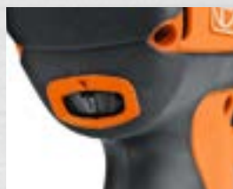
Inställbara vridmoment efter skruvdimension