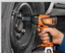
Lossa skruvar som sitter hårt fast