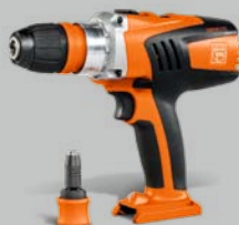
4-girs batteridrevet borskruttrekker