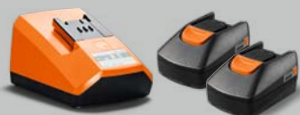
Batteri start sett