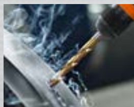
Vitesses de coupe optimales