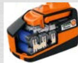
Longue durée de vie