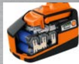
Longue durée de vie