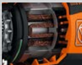
Moteurs sans balais FEIN PowerDrive

Les perceuses-visseuses sans fil FEIN sont ultra-performantes grâce à une interaction parfaite entre la batterie, le système électronique et le moteur. Les moteurs sans balais FEIN PowerDrive convainquent par une durée de vie maximale. Le rendement d'environ 30% supérieur préserve la batterie, augmentant ainsi sa durée de service. Les vitesses de rotation élevées se traduisant par des vitesses de travail optimales permettent un perçage rapide et précis dans le métal. Les accessoires QuickIN permettent de passer plus rapidement d'une application à l'autre.