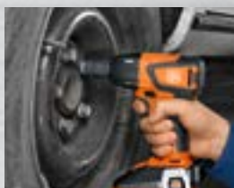
Desserrage de vis très grippées