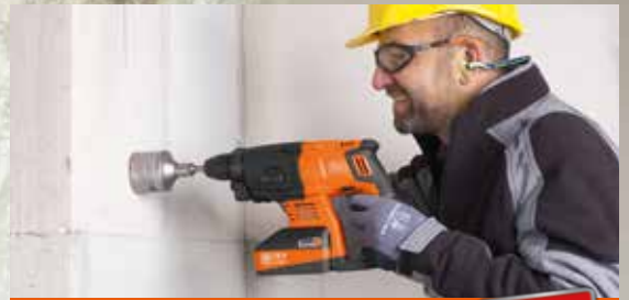
Akku-Bohrhammer ABH 18