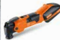
Akku MULTIMASTER AFMM 18 QSL

Bewährt bei Profis auf der ganzen Welt. Für den universellen Einsatz in Ausbau und Renovierung. Mit Anti-Vibrations-System für minimale Körperbelastung.