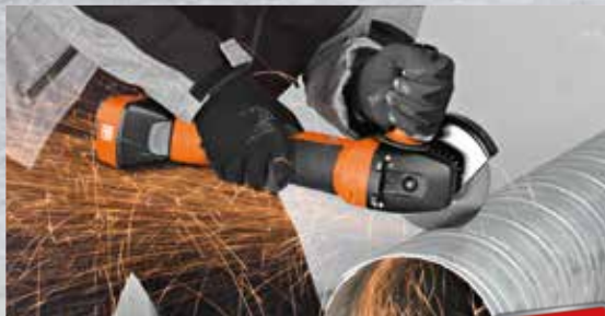
Akku-Winkelschleifer CCG 18-125 BL

Bewährt bei Profis auf der ganzen Welt. Für den universellen Einsatz in Ausbau und Renovierung. Mit Anti-Vibrations-System für minimale Körperbelastung.