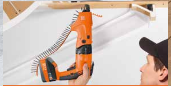
Akku-Trockenbauschrauber ASCT 18 M

Leistungsstarker Akku-Winkelschleifer für alle Trenn-, Schleif-, und Entgratarbeiten. Mit 100% staubgeschütztem Motor.