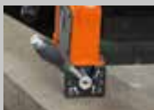
WŁ. 100% siły mocowania