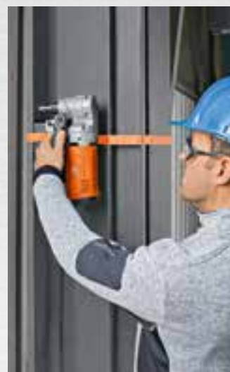
Függőlegesen és fej fölött is