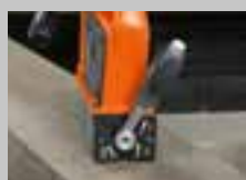
KI 0%-os tartóerő