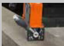
BE 100%-os tartóerő