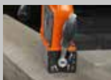
Előmágnesezés 30%-os tartóerő