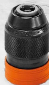
1 x Mandrin de perçage 120 Nm, 13 mm