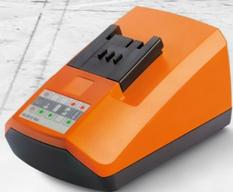
1 x Chargeur ALG 50