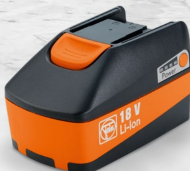
1 x Batterie 18 V 5,0 Ah