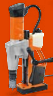
KBM 50 U Universal-Magnet- Kernbohrmaschine bis 50 mm

KBU 35-2 Q Best.-Nr.: 7 270 57 61 00 0 KBU 35-2 QW Best.-Nr.: 7 270 58 61 00 0