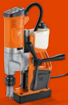
KBU 35-2 Q / KBU 35-2 QW Universal-Magnet- Kernbohrmaschine bis 35 mm

KBU 35 Q Best.-Nr.: 7 270 53 61 00 0 KBU 35 QW Best.-Nr.: 7 270 54 61 00 0