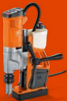
KBU 35 Q / KBU 35 QW Universal-Magnet- Kernbohrmaschine bis 35 mm