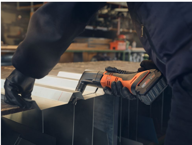
Bildunterschrift: Der ABLK 18 1.6 E zeichnet sich durch seine Wendigkeit aus. Mit ihm sind präzise Schnitte in Trapez- und Wellblechen möglich.