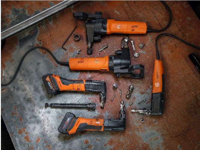
Bildunterschrift: Die FEIN Knabberfamilie

Die hochauflösenden Fotos finden Sie zum Download im FEIN Pressebereich unter: www.fein.de/presse