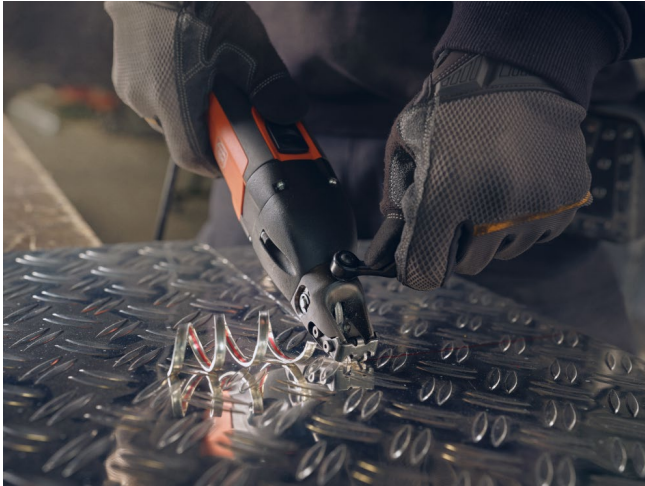
Bildunterschrift: Die FEIN Schlitzschere BSS 1.6 CE ermöglicht schnelle und saubere Schnitte mit dem integrierten Spanabtrenner.